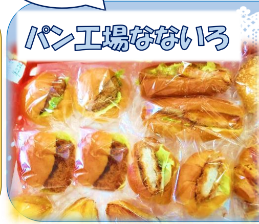
パン工場なないろ

<販売品目> 菓子パン・惣菜パン等 <日時> 6日を除く 13日、20日、27日 10:30~12:00