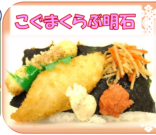
こぐまくらが明石

<販売品目> クッキー・プリン お弁当・手芸品 <日時> 7日、21日を除く 14日、28日 11:00~12:00